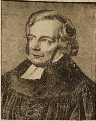
Zum 100. Todestag Schleiermachers Friedrich Schleiermacher, der grosse evangelische Kanzelredner und Philosoph