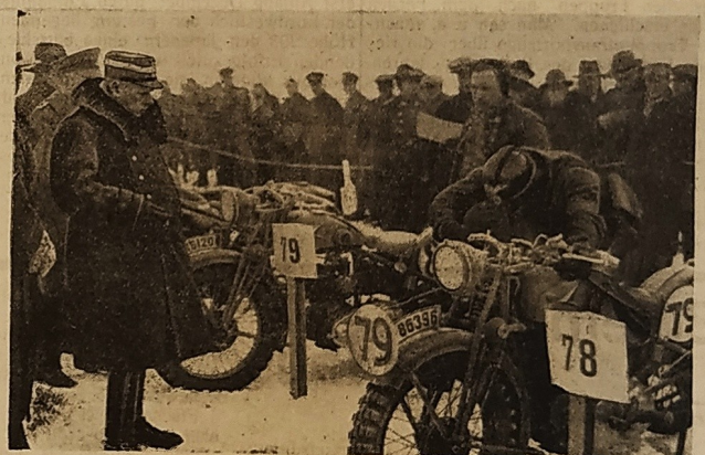
Der Start zu der Zuverlässigkeitsfahrt nach Oberstaufen Obergruppenführer Hühnlein besichtigt die Motorräder, die vor dem Beginn der Fahrt eine ganze Nacht hindurch bei strenger Kälte im Freien bleiben mussten