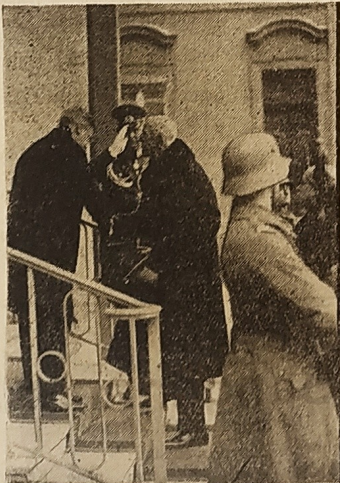
König Gustav von Schweden auf der Durchreise in Berlin

König Gustav wird vor dem Portal des Reichspräsidentenpalais von Staatssekretär Meissner empfangen.