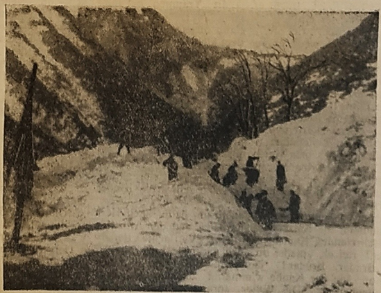
Rechts: Funkbild von den Italienischen Lawinenglücken Rettenungskolonnen bei den ersten Bergungsarbeiten am Monte Robbiano, wo wie an mehreren Stellen der Abruzzen grosse Lawinen niedergingen, die mehrere Dörfer verschütteten. Viele Personen wurden getötet und verletzt.