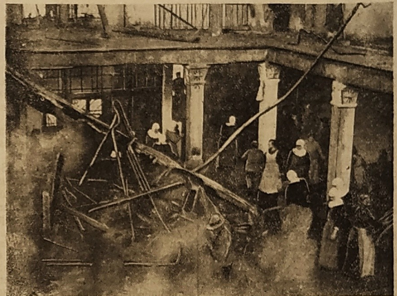
Gefährlicher Klosterbrand bei Augsburg Klosterschwestern bei der Löschung des Grossfeuers im Klosters Ursberg