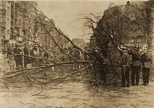
Orkan über Berlin Ein durch den Sturm umgestürzter Baum bildet eine riesige Barrikade