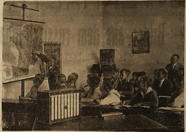
Der „Schulfunk“, eine Einrichtung, die schon der Jugend die grosse Bedeutung dieses modernen Volksbildungs- und Erziehungsmittels klar macht