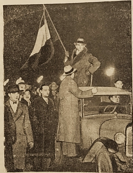
Ein Auto mit Kriegsveteranen fährt auf den Kampfplatz.