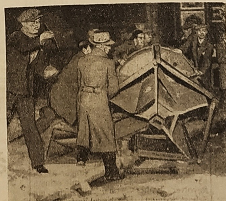
Die blutigen Unruhen in Paris Umgeworfener Kandelaber am Platz de la Concorde.

König Gustav wird vor dem Portal des Reichspräsidentenpalais von Staatssekretär Meissner empfangen.