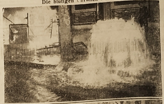
Die blutigen Unruhen in Paris