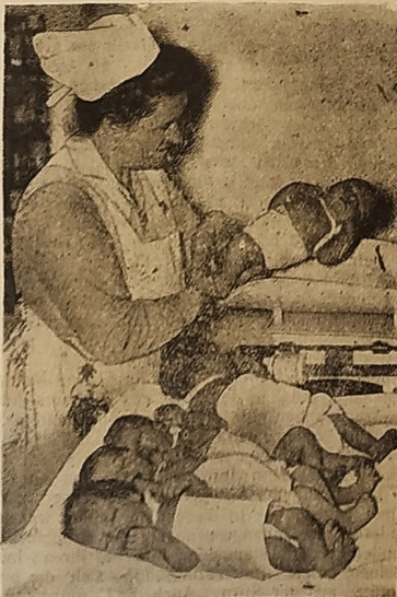
Links: Die ersten „Deutschen“ Eine Gruppe von neugeborenen Kindern der Berliner Charite, die unmittelbar nach Inkrafttreten des neuen Gesetzes über die deutsche Staatsangehörigkeit das Licht der Welt erblickten. Diese Kinder werden in ihrer Geburtsurkunde nicht mehr als „Preussen“, „Bauern“, „Sachsen“ usw. bezeichnet sondern als „Deutsche“