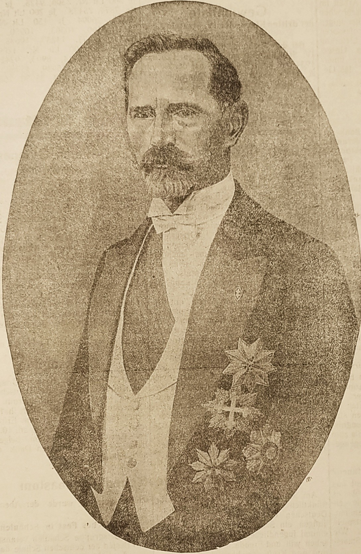
Der erste und jetzige Präsident der litauischen Republik, Antanas Smetona, der Führer des litauischen Volkes

Zum 16. Jahrestag der Unabhängigkeit Litauens am 16. Februar