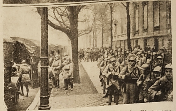
Oben: Ein typisches Bild aus den Unruhevierteln: Die kommunistischen Demonstranten haben einen Laden in Brand gesteckt und gleichzeitig einen Hydranten aufgedreht. Unten: Französisches Militär langt zur Verstärkung der Polizei an.